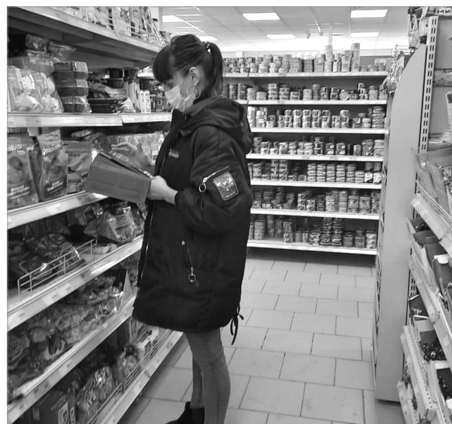
Рейды по соблюдению санитарно-эпидемиологических требований в Майминском районе

прививки от которых не ставят. Поэтому сейчас нужно уделять особое внимание мерам профилактики. Они одинаковы для всех острых респираторных вирусных инфекций: