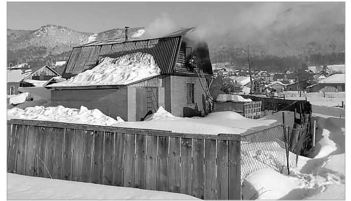
Возгорание в двухэтажном доме в Озерном по ул. Центральной

зывающих перегрузку электросети; уходя из дома, все электроприборы, кроме холодильника, отключите от розетки, так как имеется угроза возгорания при «скачках» напряжения. Помните, что нагревание вилок и розеток, потрескивание,