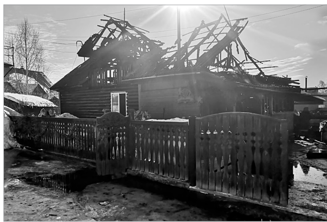
Последствия пожара в Майме по ул. Солнечной

привлекалось восемь человек и две единицы техники. В результате произошедшего сгорело жилье на площади 110 кв. м. «Как только произошел инцидент, линия электропередачи 10 кВ была оперативно обесточена по заявке МЧС. Считаю важным отметить, что строительство любых объектов в охранных зонах воздушных линий электропередачи запрещено законом. Все обстоятельства и причины данного происшествия выясняются, проводятся проверки. О ходе расследования и причинах будет сообщено дополнительно», – пишут в соцсетях представители «Россети Сибирь» в Республике Алтай.