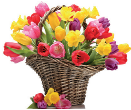
коллектив МБУК «МКДЦ»

Пусть неожиданным сюрпризом Вас жизнь сегодня удивит! Наполнит сердце оптимизмом, Мечты и грезы воплотит! Вас поздравляем с днем рождения, Пускай сопутствует всегда, Достойным целям всем - везенье, И пусть замедлят ход года!