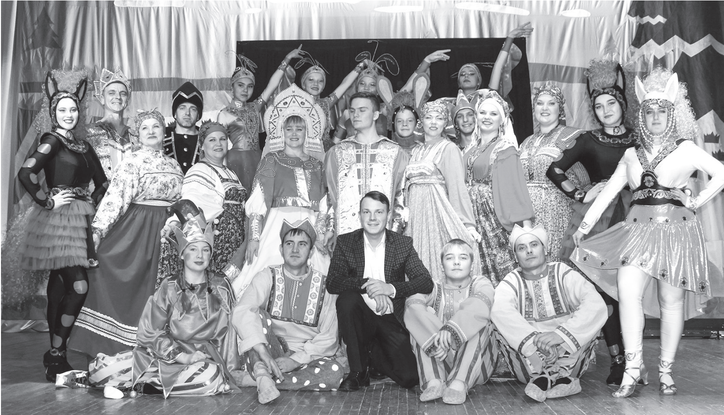
Спектакль «Конёк-горбунок» 2019г.

День работников культуры, профессиональный праздник ярких, творческих, незаурядных людей, делающих жизнь в нашем районе красивее, интереснее и духовно богаче.