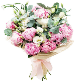
коллектив МБУК «МЦБС»

Ароматами бархатных роз, Каждым светлым, чудесным мгновеньем, Исполнением радужных грёз Будет радовать пусть День рождения! Нежных, искренних слов теплота Пусть согреет волшебным дыханьем, Чтоб в душе было счастье всегда И сбывались любые желанья!