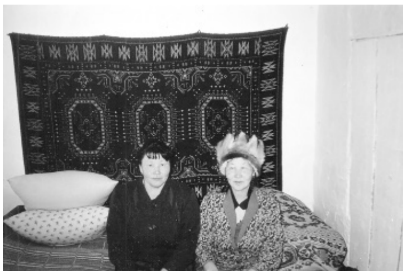
жаан байрам, сүүнчи, ырыс».