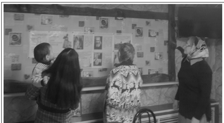
Выставка в День православной книги, 2021 г.

Часослов - книга, служащая руководством для чтецов и певцов на клиросе. Часослов содержит в себе порядок всех повседневных служб, кроме Литургии.