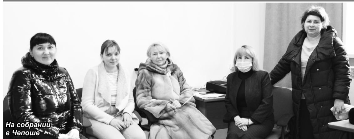
На собрании в Чепосе