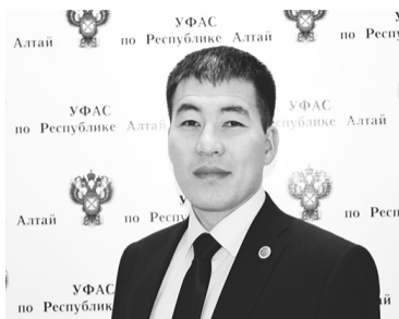
Часть изменений напрямую связана с пандемией.

- Закон о контрактной системе снова меняется, на этот раз в связи с необходимостью предупреждения и ликвидации чрезвычайных ситуаций. Распространение пандемии влияет на все сферы деятельности и жизни людей. Не исключение и контрактная система. Следом за рядом разъяснений ФАС и Минфина принят Федеральный закон от 01.04.2020 № 98-ФЗ, внесший ряд изменений в Закон № 44-ФЗ.