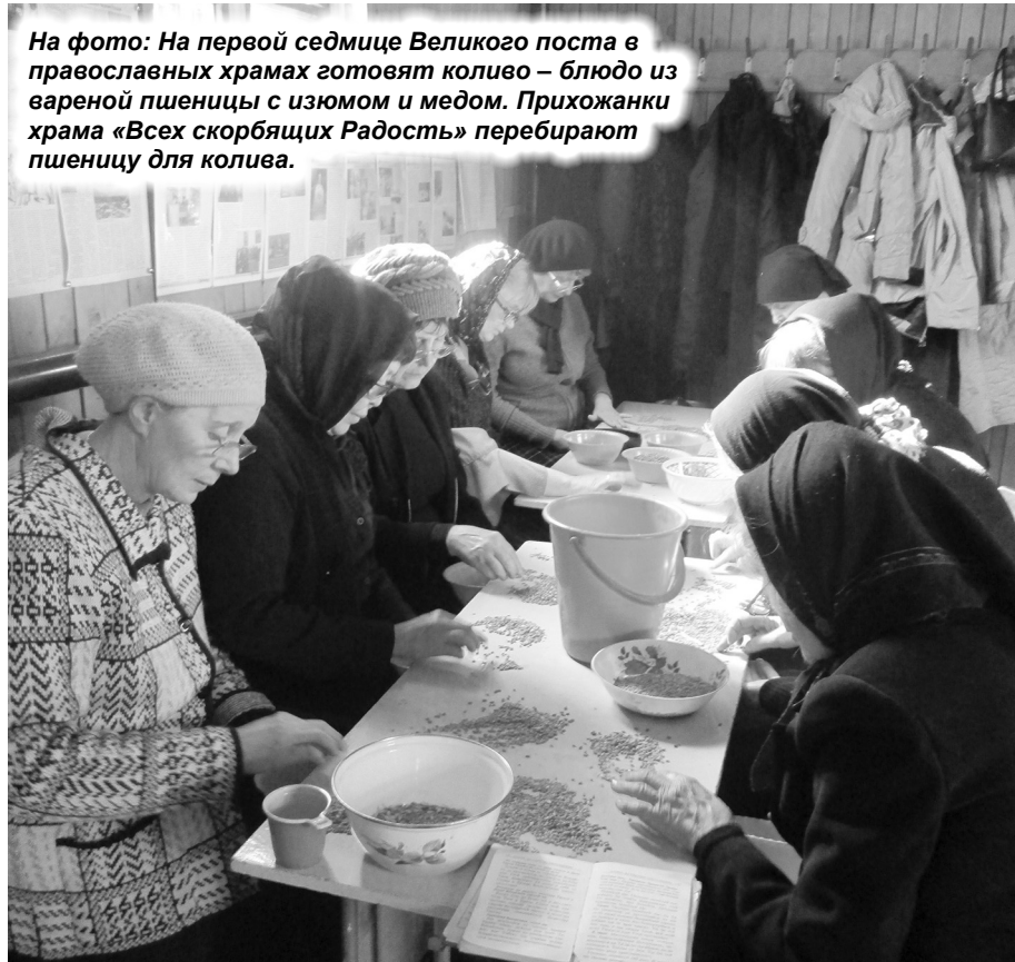
На фото: На первой седмице Великого поста в православных храмах готовят коливо – блюдо из вареной пшеницы с изюмом и медом. Прихожанки храма «Всех скорбящих Радость» перебирают пшеницу для колива.

постараешься избавиться от грязи — хотя бы чуть-чуть, хотя бы немного. Но что уж так скорбеть и убиваться, что ты от грязи избавляешься? Радоваться надо, счастье испытывать надо. Умой лицо твое, — говорит Спаситель нам, собирающимся в пост. Совет, кстати, нелишний и в нынешних наших обстоятельствах. Умыть лицо — это означает и надеть хорошую одежду, чистую, опрятную. Мы, идя в пост, идем в радость, идем встречать воскресшего Спасителя. Пост — весна нашей радости. Но и весна тревоги нашей, конечно, потому что мы, в силу своей греховной природы, не можем быть убеждены, что доживем до Пасхи. Будем Богу просить, чтобы именно для нас она пришла, чтобы Христос нас не оставил Своим Воскресением. Давайте, входя в Великий пост, все это иметь в виду. Это то, о чем напугивали нас апостол Павел и евангелист Матфей, передавая слова Спасителя.