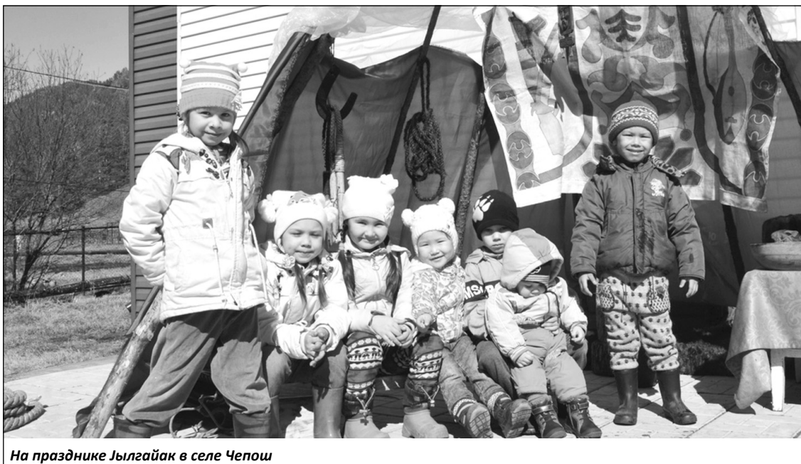
На празднике Яылгайак в селе Чепов