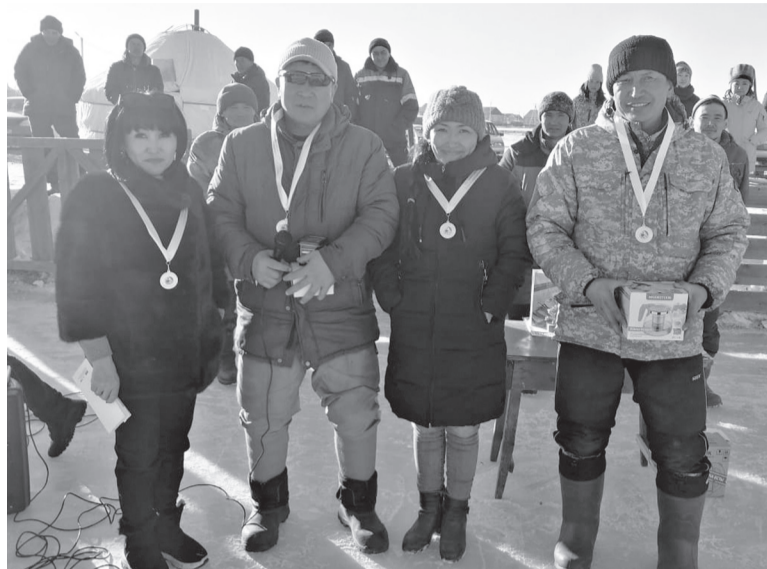
Лучший судья с организаторами турнира