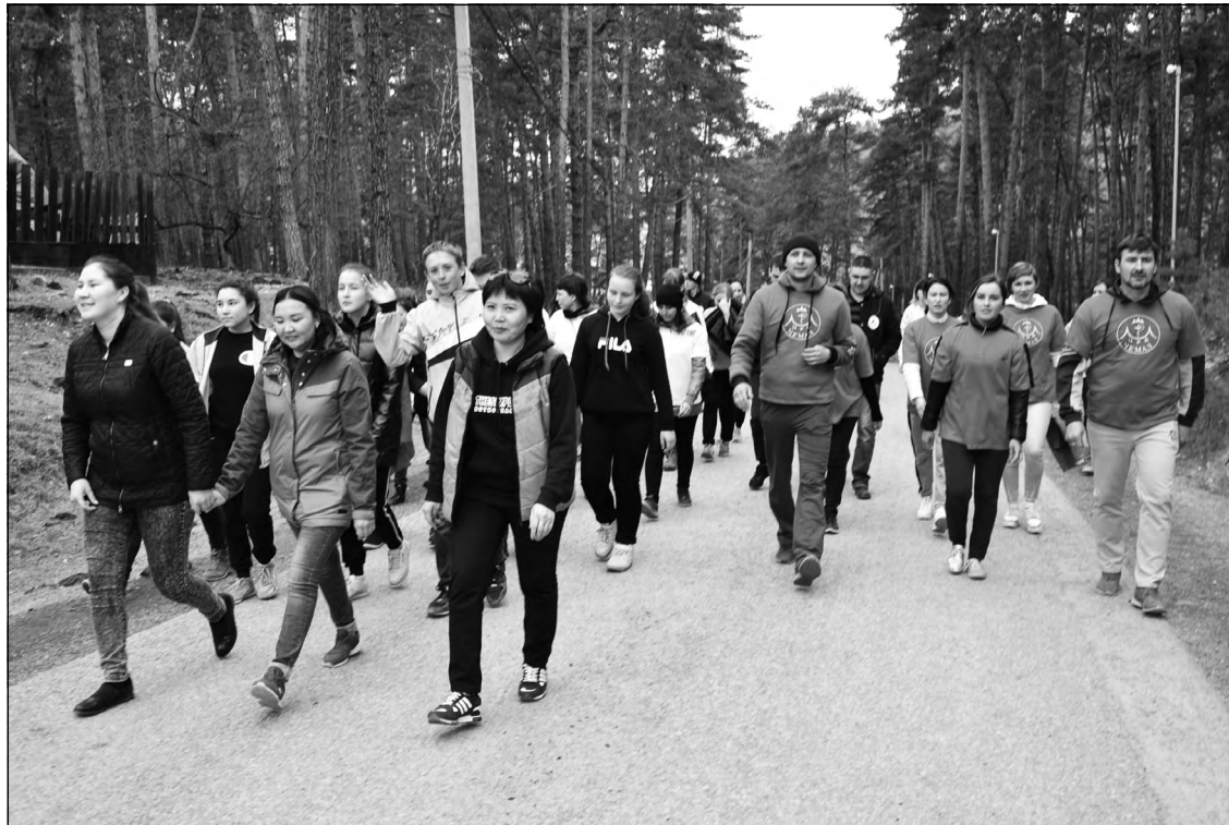
На фото: акция «3000 шагов - маршрут здоровья». Подробнее на стр. 3

Районная газета. Издаётся с 23 мая 1993 г.