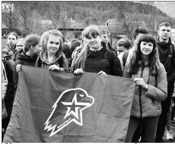
Одни из самых активных участников - юнармейцы Элекмонарской школы