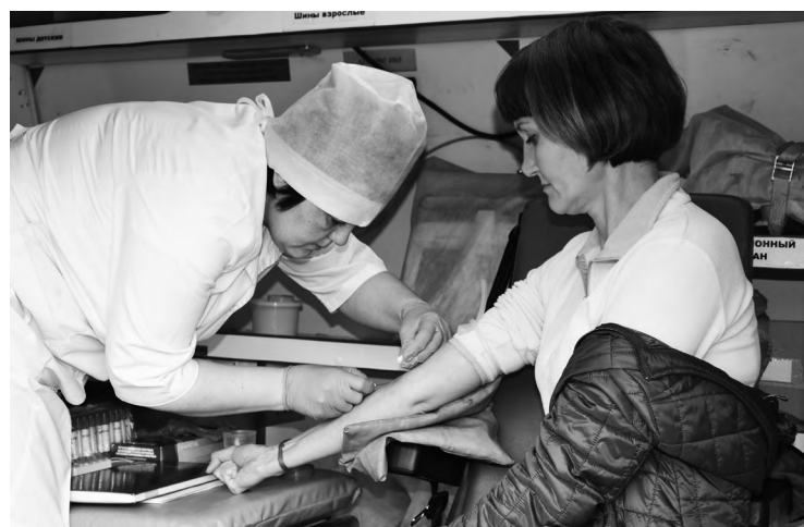
Перед стартом все могли проверить артериальное давление и прочие важнейшие параметры здоровья в специальном передвижном медицинском пункте