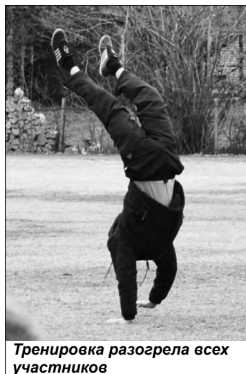
Тренировка разогрела всех участников