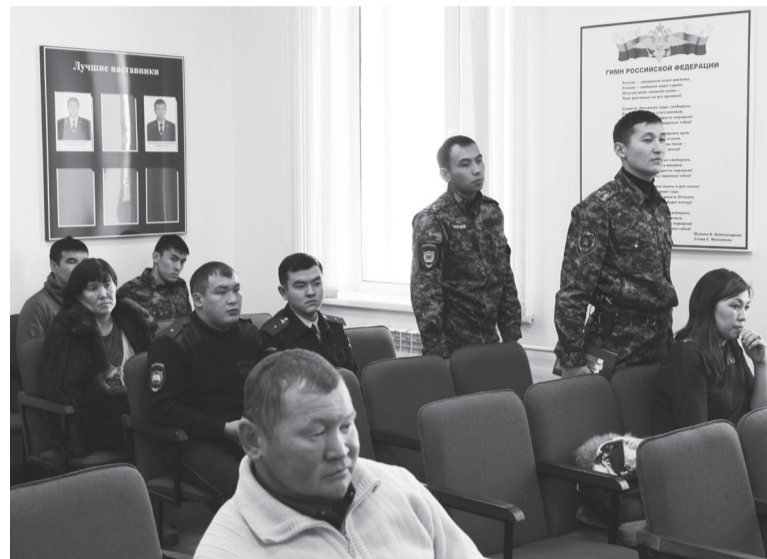
К рейду готовы

ских учетах, из них 6 условно осужденных, у двух выявлены нарушения обязанностей, возложенных судом (смена места жительства без уведомления и нарушения ограничения), 6 неблагополучных семей, кроме этого, выявлена 1 неблагополучная семья, которая поставлена на учет;