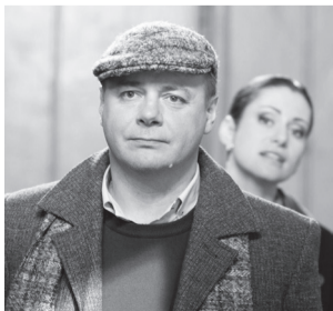
01.15 Х/ф «Теория невероятности» (12+)