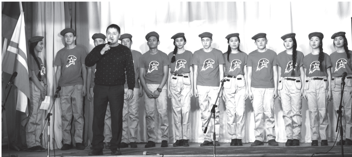
На снимке: юнармейцы Кош-Агачской СОШ имени В.И. Чаптынова

PS. Конституция - основной закон государства, определяющий его устройство, порядок и принципы образования представительных органов власти, избирательную систему, основные права и