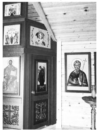
Фрагмент интерьера строящегося храма апостола Андрея Первозванного на Рублевке, Чемальский район