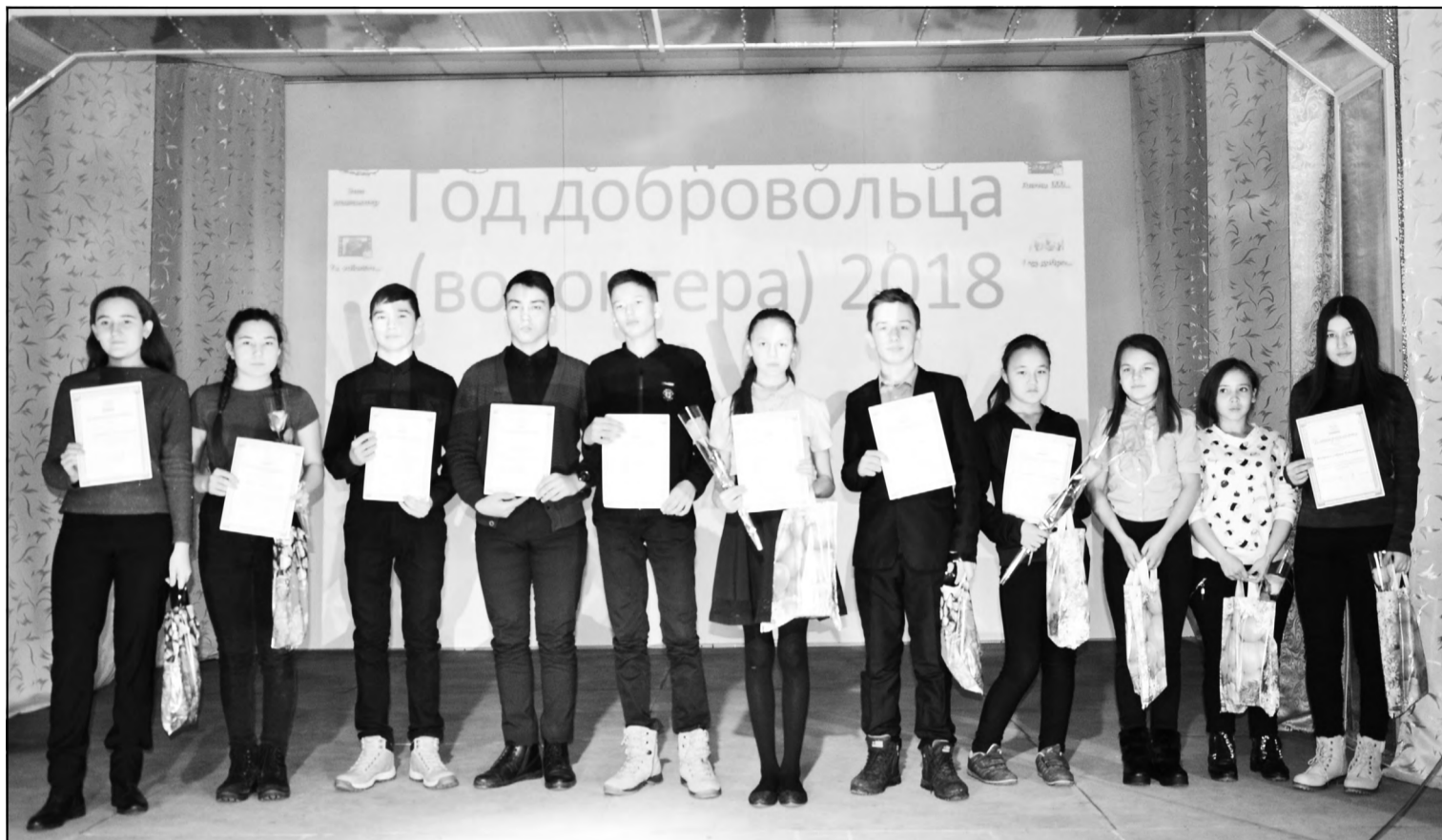
На церемонии закрытия Года добровольца, которая состоялась 6 декабря в Элекмонарском Доме культуры. Подробнее - на стр. 4

Районная газета. Издается с 23 мая 1993 г.