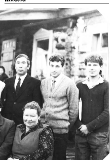
Коллектив Узнецинской школы, 1987 год

временными требованиями, оборудована спортивная площадка.